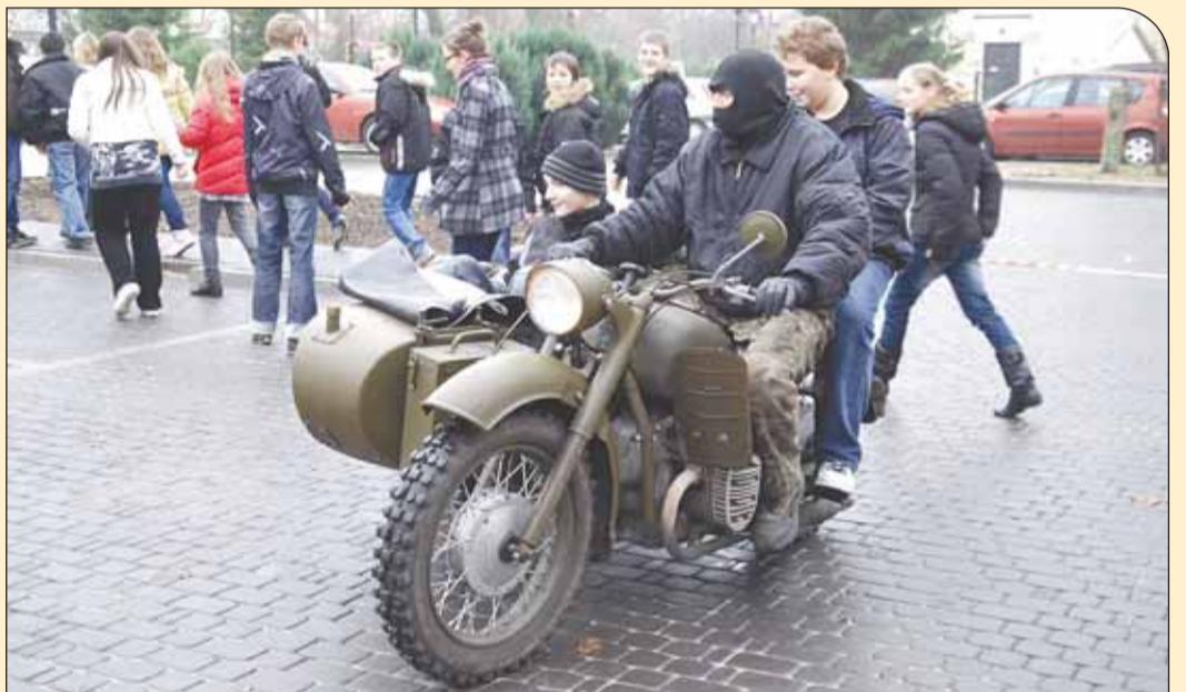
Atrakcyjna przejażdżka motocyklem wojskowym

W miejscu, w którym kiedyś na Osiedlu w Białobrzegach była kawiarnia Fala, a które od wielu lat stało puste, pojawili się młodzi ludzie. Z pomysłem na działanie, na odkrycie miejscowości na nowo dla siebie i innych.