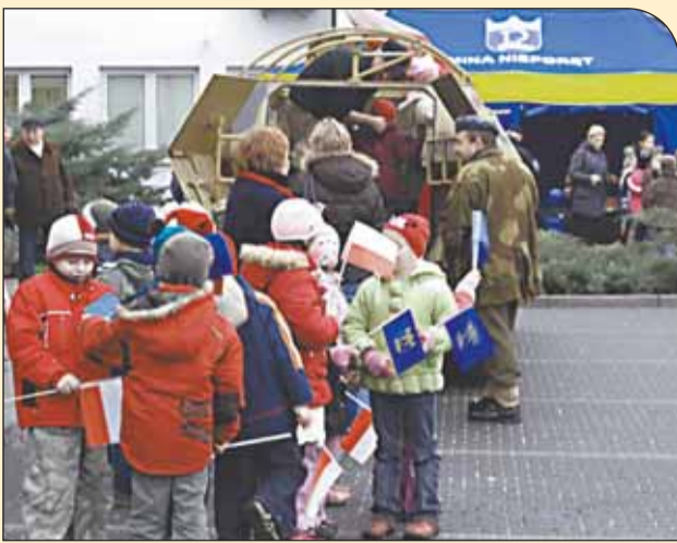
Poznanie wozu opancerzonego