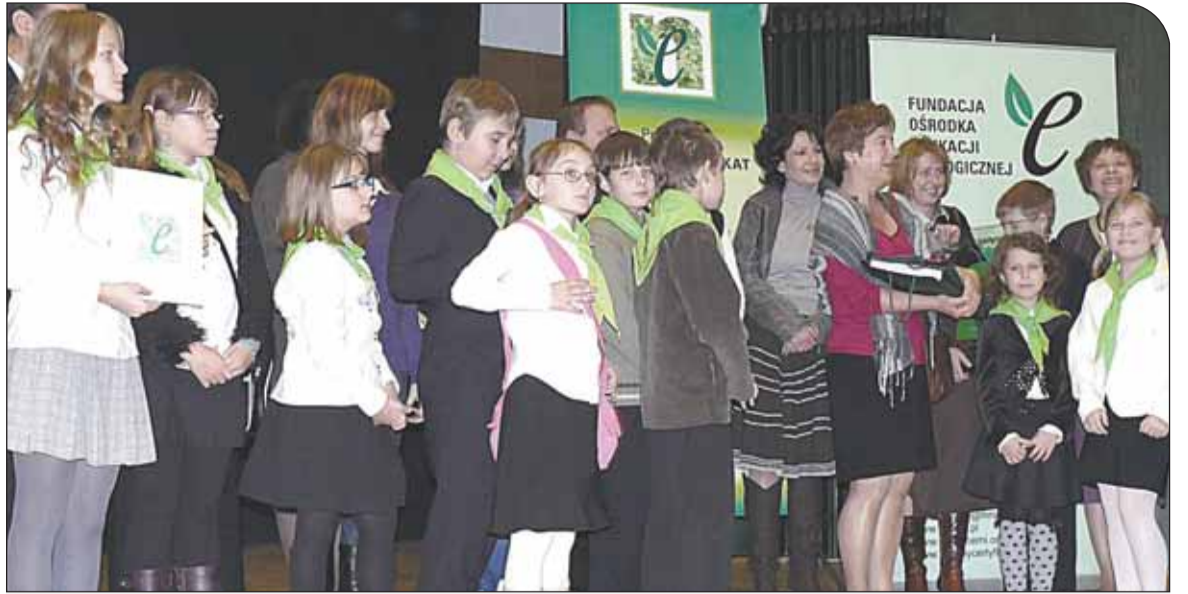
Zielony certyfikat odbierają przedstawiciele Szkoły Podstawowej w Izabelinie

10 listopada podczas ogólnopolskiej gali Fundacji Ośrodka Edukacji Ekologicznej wręczono „Zielone Certyfikaty” - znaki jakości pracy placówki oświatowej, przyznawane za działania na rzecz zrównoważonego rozwoju.