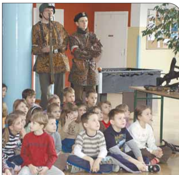
Lekcja historii w Józefowie

Świąto Niepodległości obchodzone jest uroczystością we wszystkich szkołach. Organizowane są akademie, których program poetycki i muzyczny przypomina burzliwe dzieje Polaków i ich walkę o odzyskanie wolnego kraju.