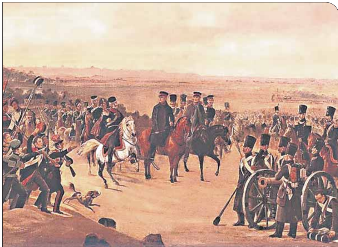
Generałowie Chłopicki i Skrzyński na czele wojsk polskich, obraz Januarego Suchodolskiego