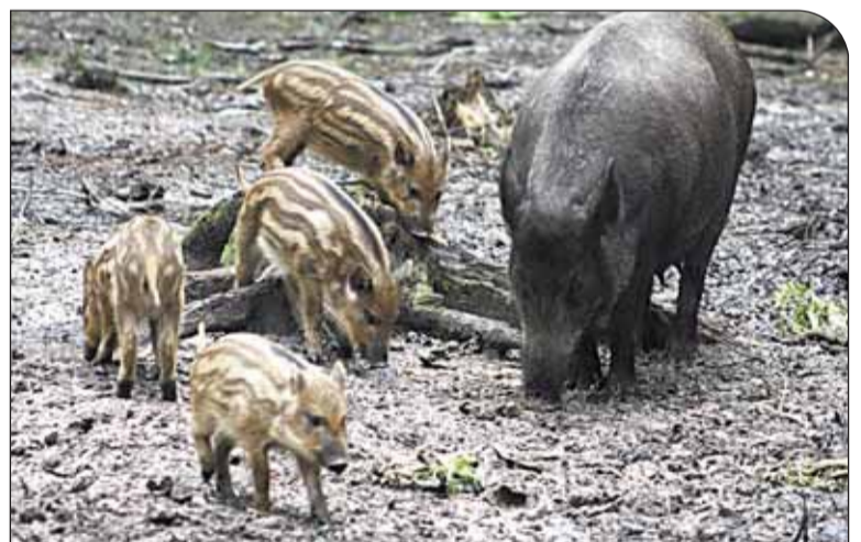
Locha z młotami

Aby zminimalizować ryzyko niechcianych wizyt, nie należy dzików dokarmiać i przyzwyczajając do darmowego posiłku. Zachęcone przez człowieka, zaczynają pojawiać się w coraz większej liczbie w najbliższym naszym otoczeniu. Młode pokolenie dzików przyzwyczajone do dokarmiania będzie stale wracać w te miejsca. Wizyty, które początkowo wydawały nam się sympatyczne i interesujące, wkrótce mogą stać się dla nas uciążliwe.