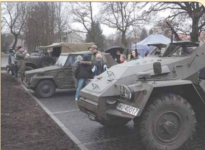
Wystawa wozów bojowych