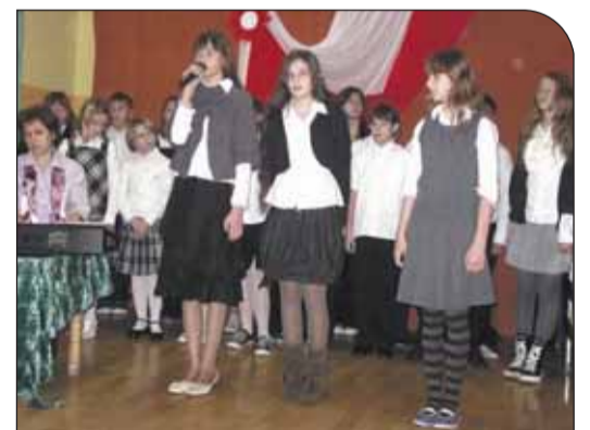
Wieczornica w SP w Izabelinie