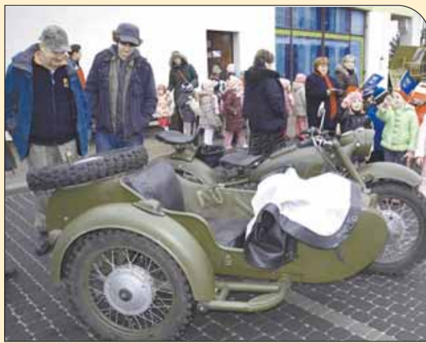
Motocykl wojskowy z koszem budził zrozumiałe zainteresowanie