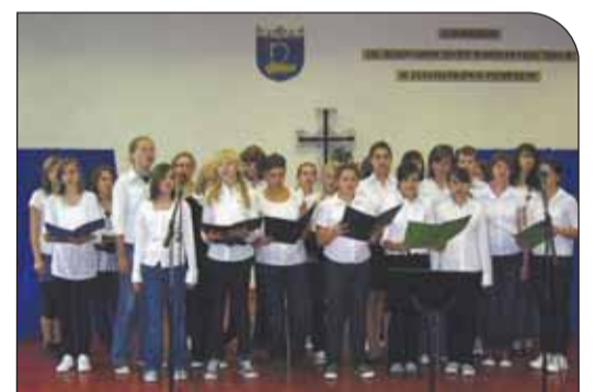
Uroczystość w Gimnazjum