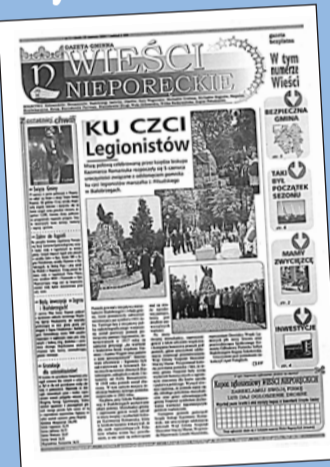
Tak wyglądał pierwszy numer Więści Nieporęckich