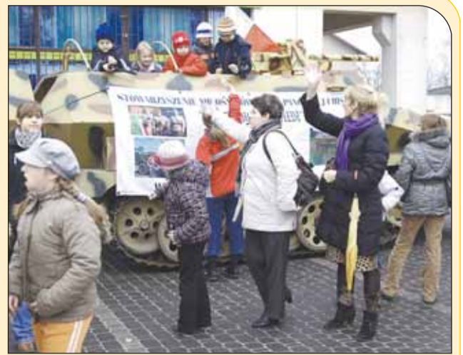
Wóz opancerzony był oblegany